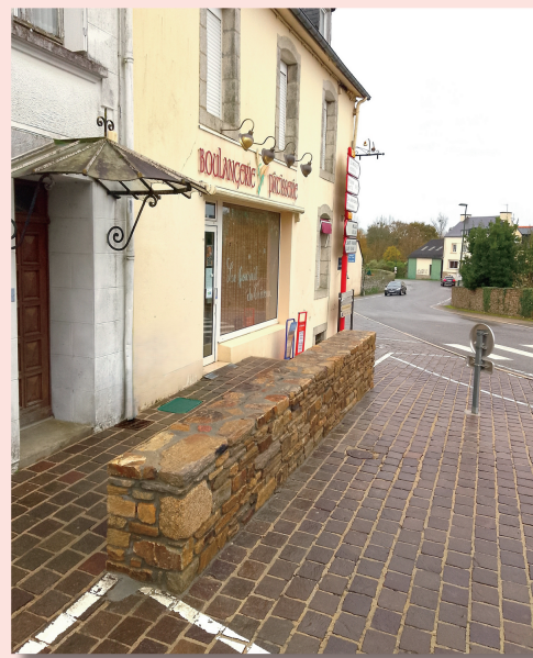
Nouveau muret sur le parvis de la boulangerie