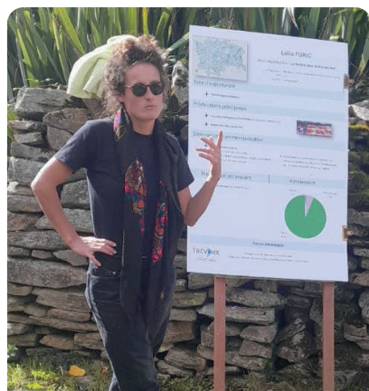
Balade agricole, dimanche 5 octobre