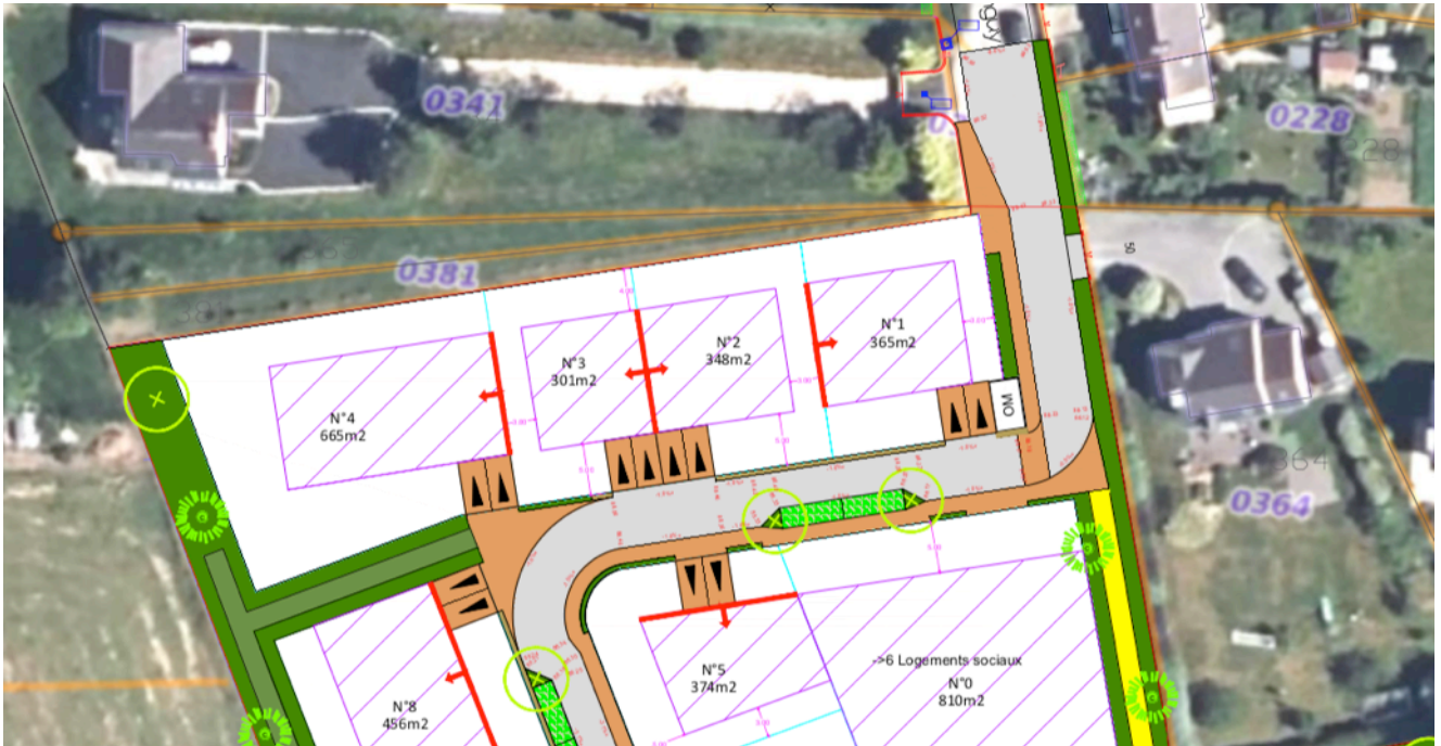
Intégration des 2 places de stationnement